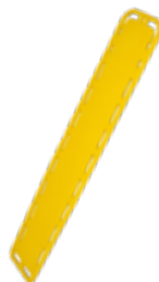
Galaxy - Tavola spinale

Il dispositivo più utilizzato dagli operatori.