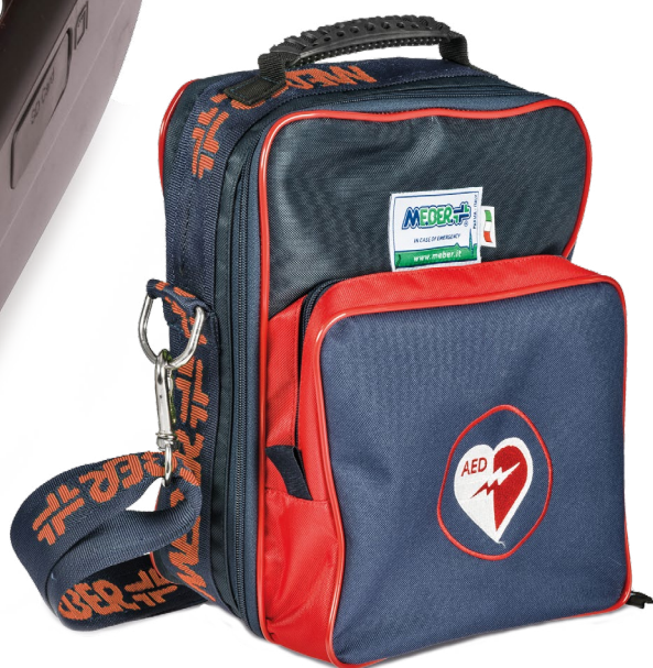
ART. 1368/RB Custodia per defibrillatore con tasca anteriore piccola