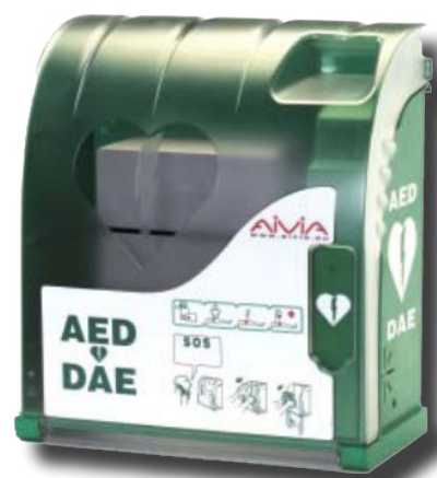
ART. 8429 Teca per defibrillatore colore verde per defibrillatori AED