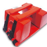
FERMACAPO ART. 629