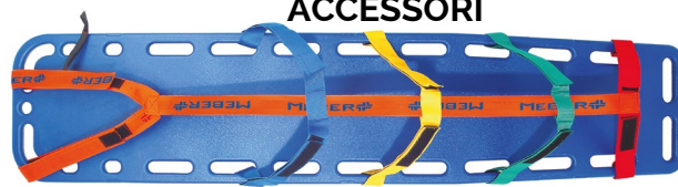
CINTURE RAGNO ART. 690