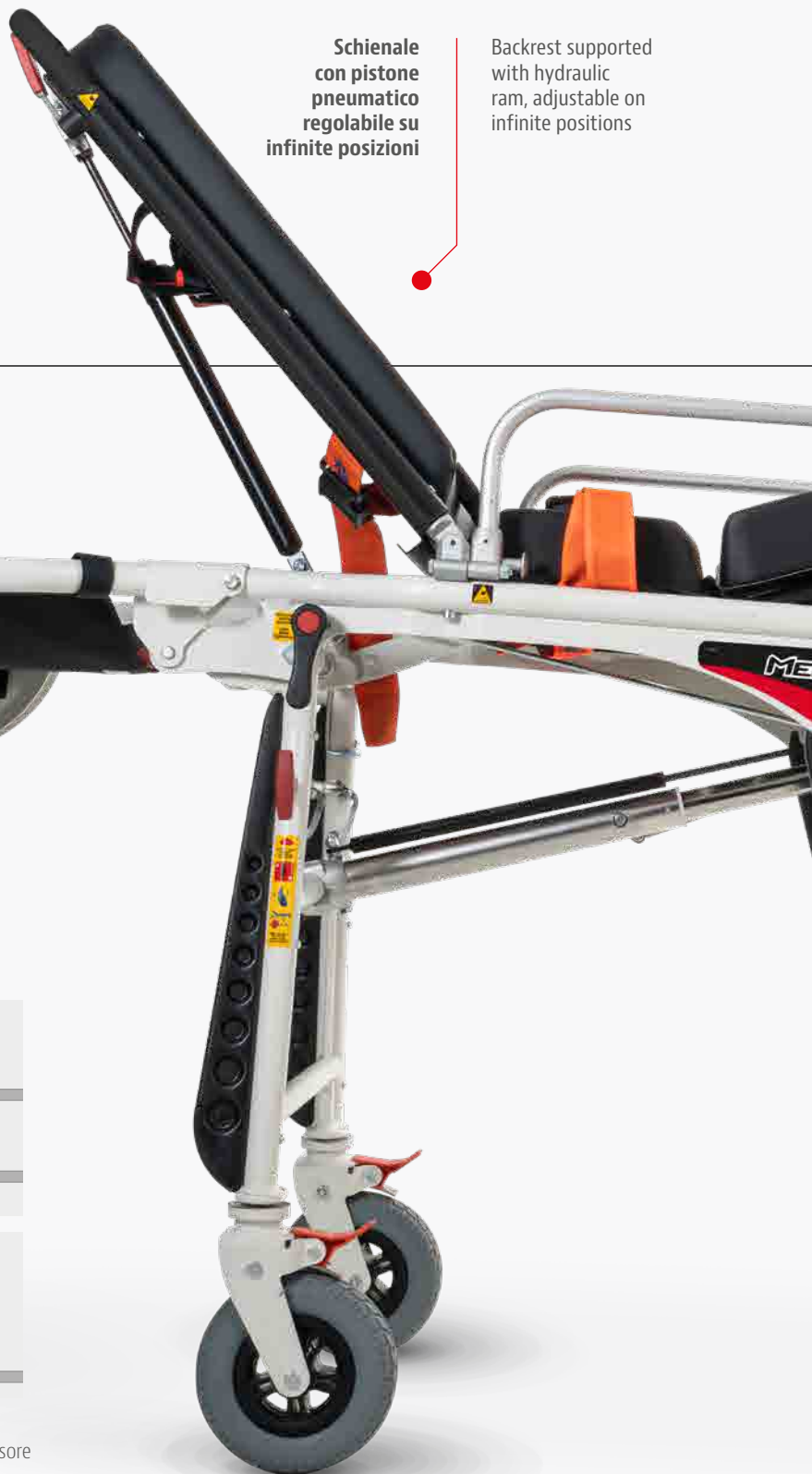
Backrest supported with hydraulic ram, adjustable on infinite positions