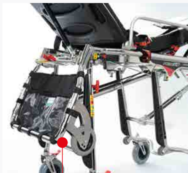
Carrello anteriore abbattibile con alloggiamento porta documenti/oggetti