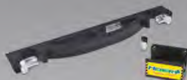
Art. 959 Sistema di fissaggio a parete

Dispositivo certificato secondo gli standard armonizzati di sicurezza europei UNI EN 1865 - UNI EN 1789