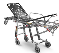
Mercury Cinque 7075/4RG PROOF Barella autocaricante inox a 5 posizioni certificata EN1865 con 4 ruote girevoli