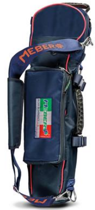
12072/BR "COVER OX 5 BR"- Portabombola professionale per bombole da 5