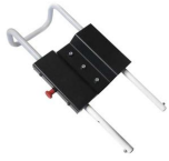
12128 Sistema allungabile per poggiatesta barella MeberX e Mercury