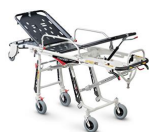
Mercury Lite 7080/4RG Proof Barella autocaricante in alluminio ad altezza variabile certificata con 4 ruote girevoli