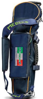
12072/BG "COVER OX 5 BG"- Portabombola professionale per bombole da lt 5