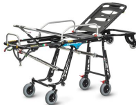
Mercury EL 7092 PROOF Barella autocaricante certificata