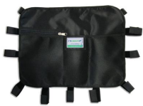
12025 Tasca portaoggetti multiuso nera per barelle autocaricanti