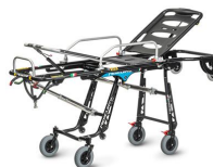
Mercury EL 7092 PROOF Barella autocaricante certificata