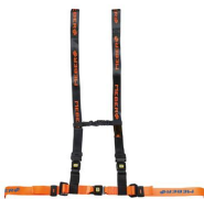
612/AN-2/MEB Cintura toracica regolabile arancio/nera con aggancio a 4 punti e nastro MeBer per barelle autocaricanti e sedie