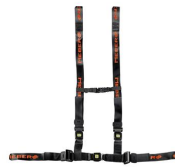
612/N-2/MEB Cintura toracica regolabile nera con aggancio a 4 punti e nastro MeBer per barelle autocaricanti e sedie