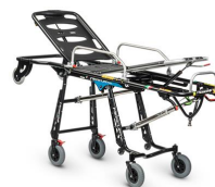
Mercury EL 7094 PROOF Barella autocaricante certificata versione alta