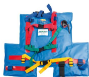
Halley 880 Vakuum-schienenverband für das Bein