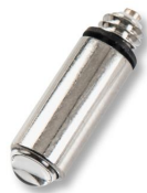
1681 Lampadina alogena 2,5v per manico laringoscopio a fibra ottica