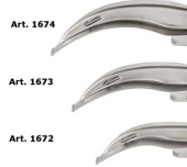
1678 McIntosh Set laringoscopio 3 lame fibra ottica