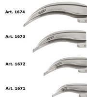
1679 McIntosh Set laringoscopio 4 lame fibra ottica