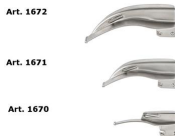
1677 McIntosh Set laringoscopio pediatrico 3 lame fibra ottica