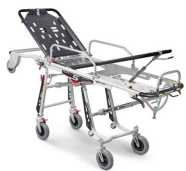
Mercury Lite Cinque 7095/4RG Proof

Mercury Lite Cinque, barella autocaricante in alluminio a 5 posizioni con 4 ruote girevoli certificata EN 1865 e completa di materasso e cinture