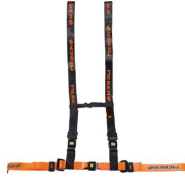
612/AN-2/MEB Cintura toracica regolabile arancio/nera con aggancio a 4 punti e nastro MeBer per barelle autocaricanti e sedie