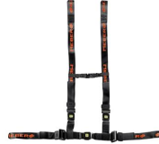
612/N-2/MEB Cintura toracica regolabile nera con aggancio a 4 punti e nastro MeBer per barelle autocaricanti e sedie