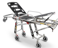
Mercury 7072/4RG PROOF Barella autocaricante inox ad altezza variabile certificata con 4 ruote girevoli versione alta