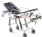
Mercury Lite 7082/4RG Proof Barella autocaricante in alluminio ad altezza variabile certificata con 4 ruote girevoli versione alta