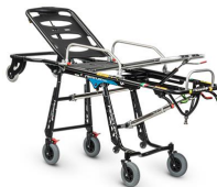
Mercury EL 7094 PROOF Barella autocaricante certificata versione alta