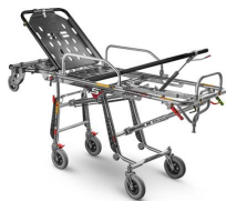
Mercury Cinque 7075/4RG PROOF Barella autocaricante inox a 5 posizioni certificata EN1865 con 4 ruote girevoli