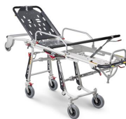
Mercury Lite Cinque 7095/4RG Proof Mercury Lite Cinque, barella autocaricante in alluminio a 5 posizioni con 4 ruote girevoli certificata EN 1865 e completa di materasso e cinture