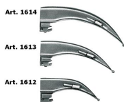
1618 McIntosh Set laringoscopio 3 lame luce convenzionale