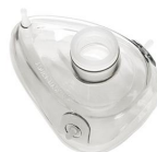
2404 Mascarilla de reanimación en silicona med. 4