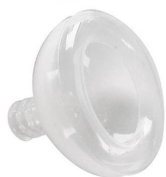
2402 Máscara de reanimación de silicona tamaño 2