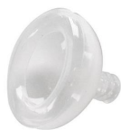
2401 Mascarilla de reanimación en silicona med.1