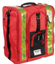
1366 Mochila roja "115" con bolsillos laterales y compartimentos SUMINISTRADO COMPLETOS - ESPECIFICACIONES TPSS