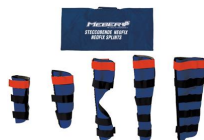
417 "NEOFIX" Set de férulas de neopreno con estuche