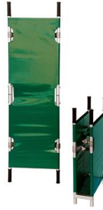
6100 Camilla plegable larga para uso veterinario