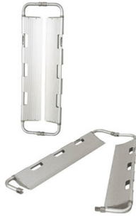
Maxima 6200 Camilla atraumática de cuchara pediátrica