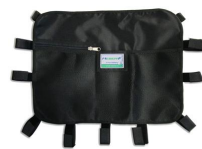
12025 Tasca portaoggetti multiuso nera per barelle autocaricanti