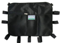
12025 Tasca portaoggetti multiuso nera per barelle autocaricanti