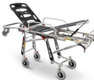
Mercury 7070/4RG PROOF Barella autocaricante inox ad altezza variabile certificata con 4 ruote girevoli