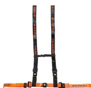
612/AN-2/MEB Ceinture thoracique orange/noire réglable avec attache à 4 points et ruban Meber pour brancards à chargement automatique et chaises