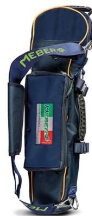
12072/BG « COVER OX 5 BG » – Porte-bouteille professionnel pour bouteilles de 5 litres