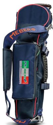
12072/BR « COVER OX 5 BR » – Porte-bouteille professionnel pour bouteilles de 5 litres