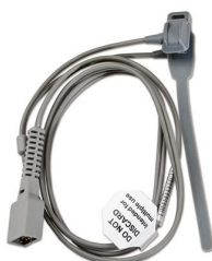
11208 Sensore pediatrico per pulsossimetro Vital Test