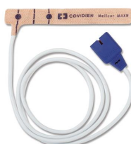
11212 Sensore neonatale per pulsossimetro Vital Test