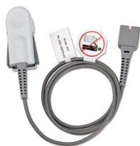
11206 Sensore adulti per pulsossimetro Vital Test